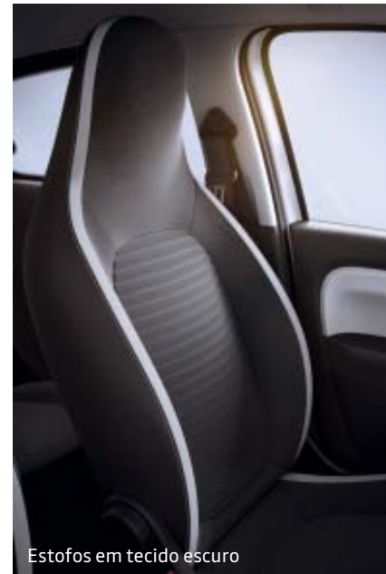
Estofos em tecido escuro