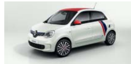
Pack Le Coq Sportif Extreme