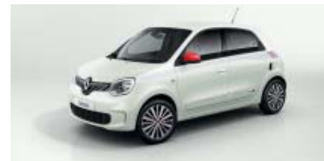
Pack Le Coq Sportif Light