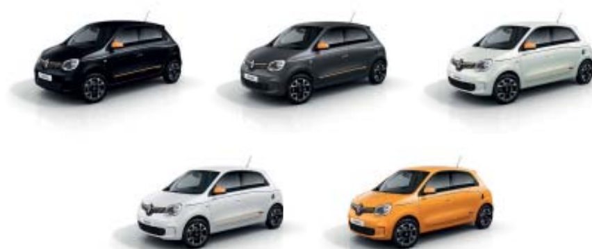
Personalização exterior em amarelo