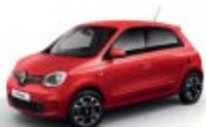
Personalizações exteriores em vermelho