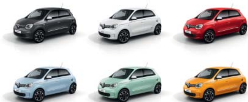
Personalização exterior em branco