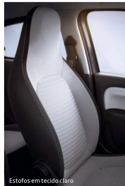
Estofos em tecido claro