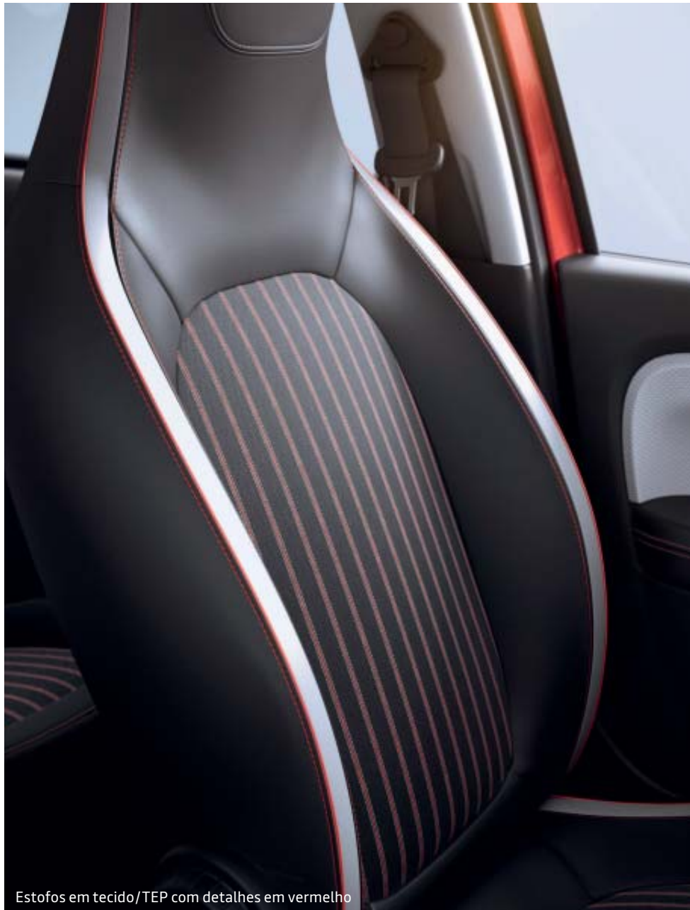
Estofos em tecido/TEP com detalhes em vermelho